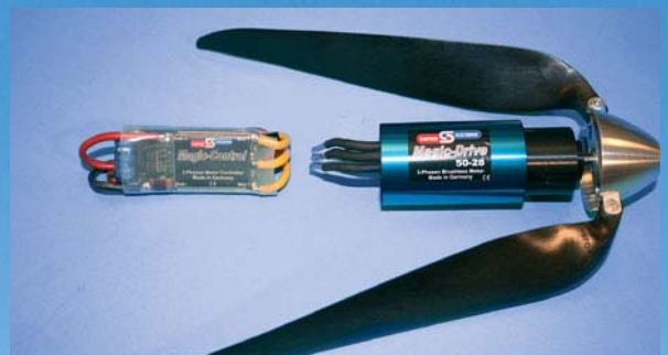
»Power-Version« mit Magic-Drive 50-28