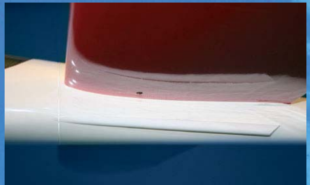
Features: Kufe, Schwerpunktmarkierung, Anti-Rutsch-Noppen, Flächenausrichtarretierungsauflage und Design-Anforderungen für Kühlluftaustritte und zum besseren Anfassen beim Start.