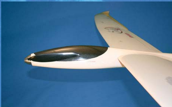
die typische Handschrift der SIMPROP-Modelle