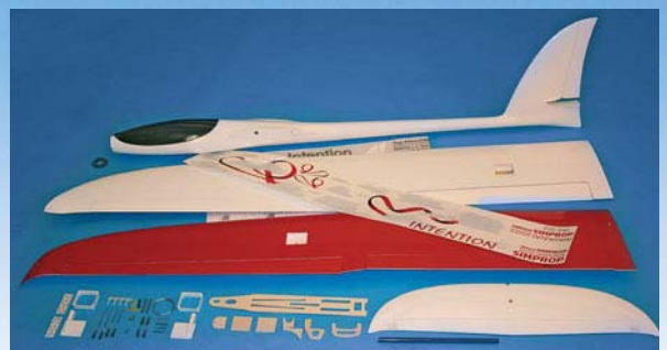
ARF-Version Best.-Nr. 031 131 6 (Unterseite ferrarirot bespannt) ARC-Version Best.-Nr. 031 130 8 (unbespannt), o. Abb.