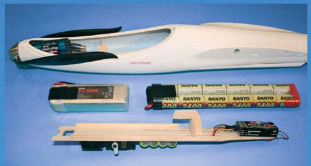
raumsparender Akku- und RC-Einbau, Akkuwechsel durch die Kabinenhaube

hochwertiger CFK-verstärkter GFK-Rumpf inkl. Flächen- und Leitwerksaufnahme sowie laminiertes, anscharniertes und funktionsfähiges Seitenruderklappe, passgenauer CFK-Kabinenhaube und einiger nicht üblicher Details. Leichte und hochfeste, geteilte SIMPROP High-Tech Fertigfläche (Abachi-Styro) mit fertig anscharnierten Querrudern und Wölbklappen inkl. Steckstahl sowie aller Ausfräsungen und Details (bespann- und installationsfertig), profiliertes, schraubbares Höhenleitwerk in gleicher Ausführung, exakt gestanzte und gesägte Holzteile für RC- und Akkuaufnahme, Seilanlenkung für Seitenruderklappe, komplettes Rudergestänge (aus Polystyrol), Ruderhörner, Servoeinbaurahmen und div. Kleinteile, farbiger, selbstklebender Randbogen und Plan mit bebildeter Anleitung, ARF-Version zweifarbiger bespannt